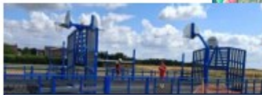
Installation du terrain multisports