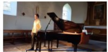
Récital de piano