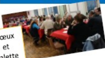
Vœux et galette