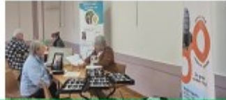
Après-midi de dépistages gratuits