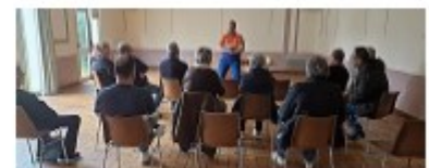
Formation aux premiers secours