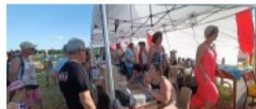
BBQ de la St Jean du Comité des Fêtes