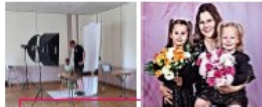
Shooting Fête des Mères