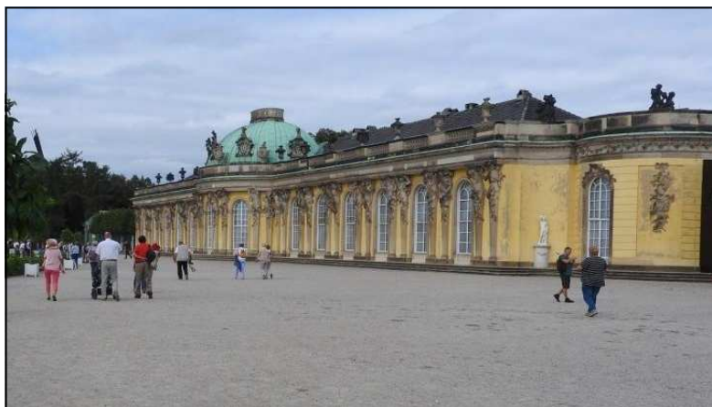
Le château de « Sans souci » à Postdam

Le lendemain, excursion à Postdam et visite du château de « Sans souci », résidence d'été de Frédéric II de Prusse, avant de prendre en bus la route de Dresde.