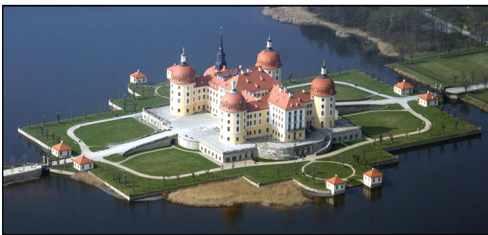
Le château de Moritzburg

Mais les plus belles choses ayant une fin, et après une dernière promenade sur l'Elbe en bateau à vapeur, le groupe s'est envolé vers l'Eure-et-Loir avec en tête des images qu'il n'est pas prêt d'oublier !