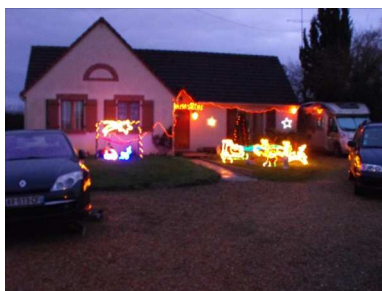
Nos habitants et nos employés communaux eux aussi ont de l'imagination et du talent