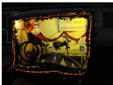
René a encore fait preuve d'imagination